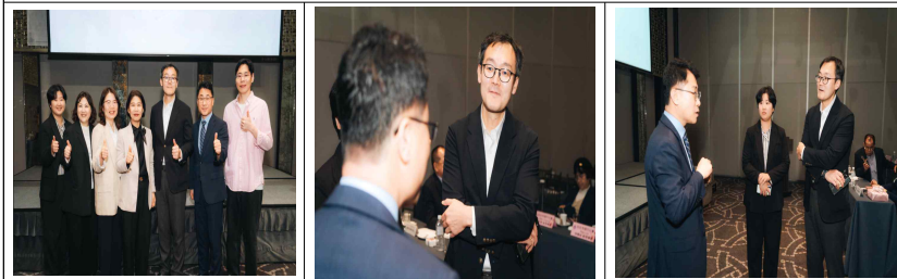
한국관광공사 타이베이 지사 관계자 현장 미팅