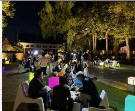
국가유산 보드게임 겨룸터