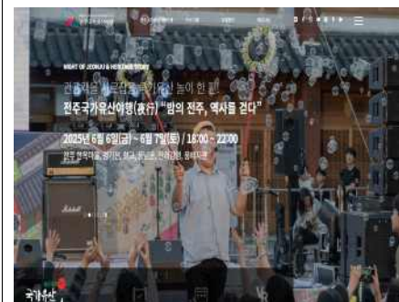
전주국가유산야행 공식 홈페이지