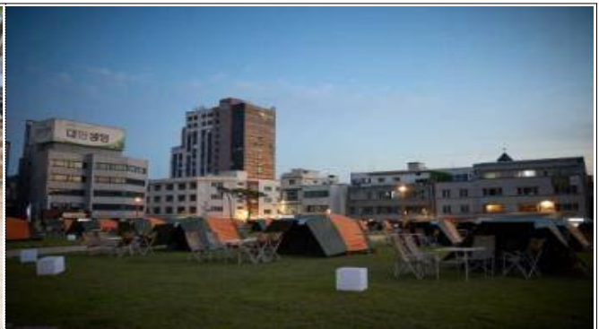
국가유산 1박 2일