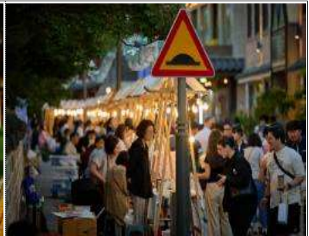
국가유산 청년 프리마켓