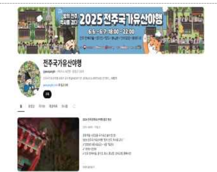
YOUTUBE 채널 활용