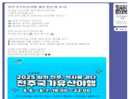
전주국가유산야행 카카오톡 채널