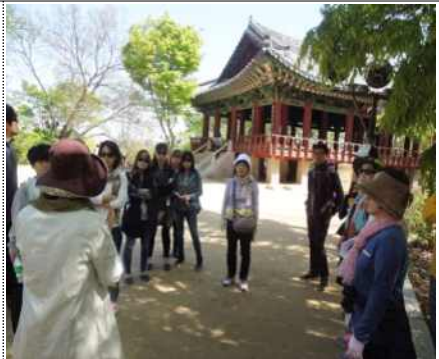
후백제의 왕궁, 야간산성행