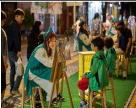
국가유산 거리의 화공